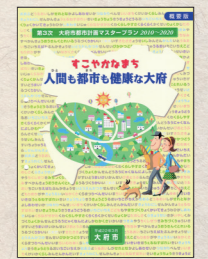
▲マスタープランは太府市HPでも閲覧可能です。