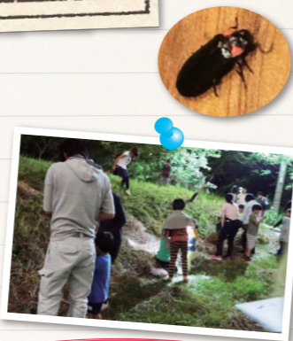
ホタル探しにみんな夢中!