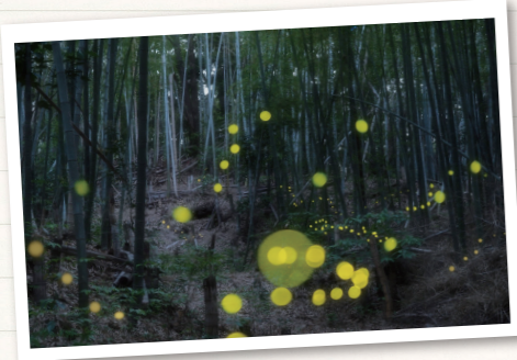
竹林を撮影してくださった加藤さんのお写真。幻想的です!

過去最多52名もの参加者は、草むらをかき分けて「すごい、光ってる!」「お父さん、ここにもいるよ」とホタルよりも目がキラキラ。多くの方とヒメボタルの感動を分かち合うことができました!